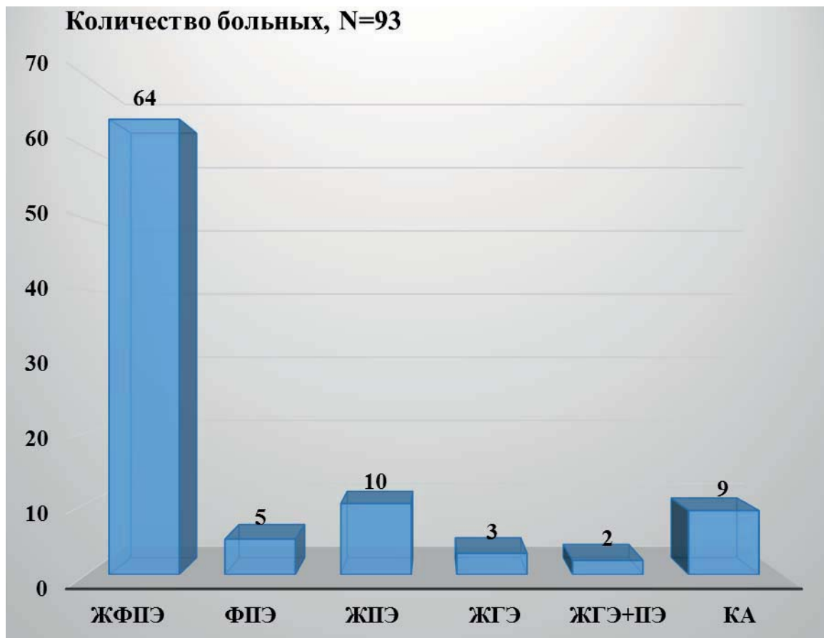
Рис. 1. Результаты гистологических исследований у обследованных больных с ГПЭ в постменопаузе, которым выполнены современные методики внутриматочной хирургии.

ЖФПЭ – железисто-фиброзный полип эндометрия; ФПЭ – фиброзный полип эндометрия; ЖПЭ – железистый полип эндометрия; ЖГЭ – железистая гиперплазия эндометрия; КА – кистозная атрофия эндометрия.