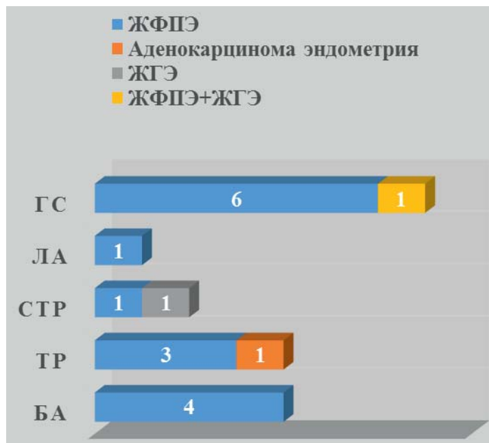
Рис. 4. Характер вида патологии эндометрия у больных в периоде постменопаузы при рецидиве ГПЭ в зависимости от метода внутриматочной хирургии.

метрия – 80%, субтотальной резекции – 84%. У пациенток группы сравнения эффективность гистероскопии с применением механического удаления патологического очага составила 77%.